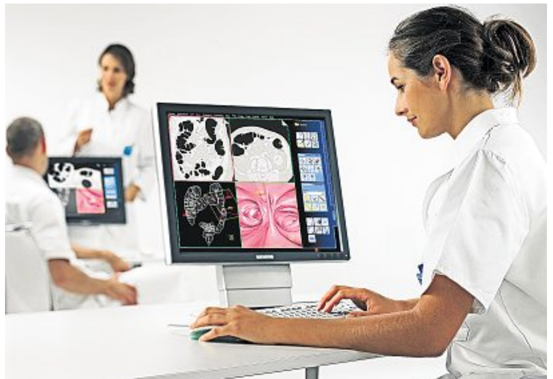
Virtuelle Koloskopie